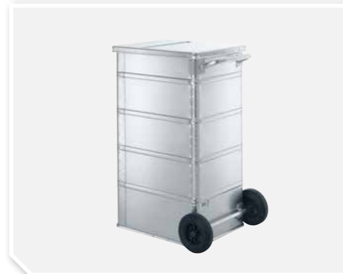
Skrzynie na dokumenty