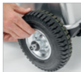
Natoczyć koło ...