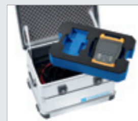
na wszystkich poziomach.