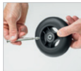
Przeciśnąć stalową oś

Montaż i demontaż zestawu kół \varnothing 125 mm - bez narzędzi i ekstremalnie szybki