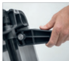
W razie potrzeby rozłożyć stojak.

W taki sposób zadacie Państwo o porządek.