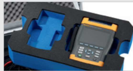
Dokładnie pasujące wkładki piankowe