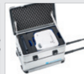
umożliwiają szybkie korzystanie...