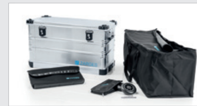
K 424 XC Nr zamówienia 41812 z pełnym pakietem wyposażeniowym

Zawiera K 424 XC nr katalogowy 41812, torbę na pokrywę nr katalogowy 41820, torbę wewnętrzną nr katalogowy 41824 oraz zestaw kół \varnothing 125 mm nr katalogowy 41818