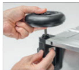
Blokada na przycisk

Zestaw kół \varnothing 125 mm – cichobieżny zestaw kół odpowiedni dla nierównych powierzchni i dłuższych dystansów