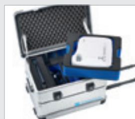
Wkładki do wyjmowania...