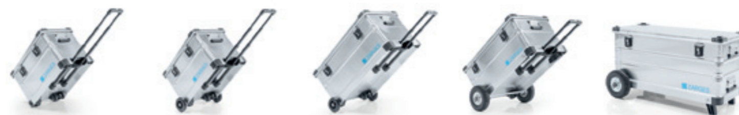
Nr katalogowy 41811 z 3-częściowym wysuwającym uchwytem i kołami Ø 50 mm wyposażenie seryjne Nr katalogowy 41811 z 3-częściowym wysuwającym uchwytem i opcjonalnym zestawem kół Ø 125 mm nr katalogowy 41818 Nr katalogowy 41813 z 2-częściowym wysuwającym uchwytem i opcjonalnym zestawem kół Ø 125 mm nr katalogowy 41818 Nr katalogowy 41813 z opcjonalnym zestawem Offroad - Ø 220 mm nr katalogowy 41832 Nr katalogowy 41815 z opcjonalnym zestawem Offroad Ø 220 mm, 2 samoczynnie składanymi uchwytami na ścianie czołowej