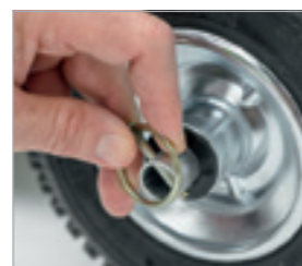
... i zablokować