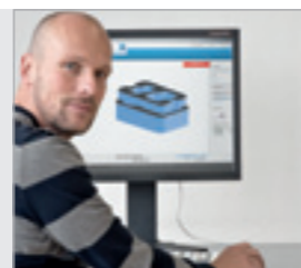
Dane 3D ułatwiają pracę nad projektem