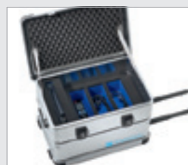
Wielokolorowe wkładki ułatwiają rozeznanie.