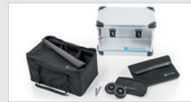
K 424 XC Nr zamówienia 41811 z pełnym pakietem wyposażeniowym

Zawiera skrzynię K 424 XC nr katalogowy 41811, torbę na pokrywę nr katalogowy 41820, torbę wewnętrzną nr katalogowy 41823 oraz zestaw kół \varnothing 125 mm nr katalogowy 41818